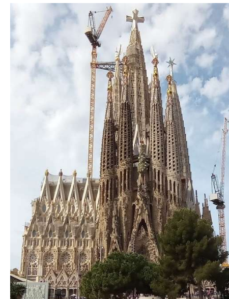
Kirche Sagrada Familia, Barcelona, Baustand 2026