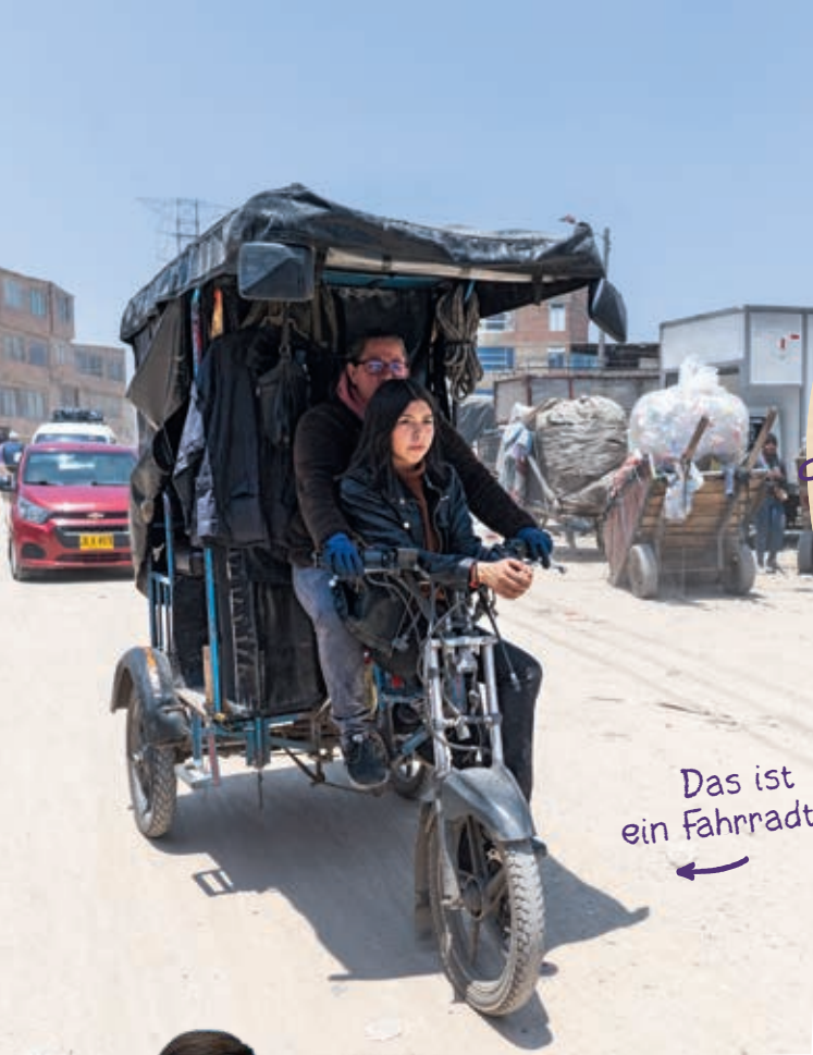
Das ist ein Fahrradtaxi